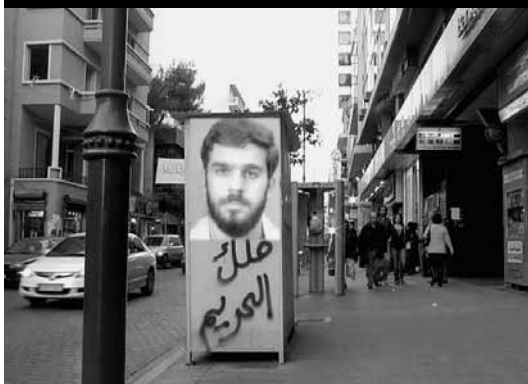
Who Needs a Heart de John Akomfrah, 1991 My Heart Beats Only for Her de Mohamed Soueid, 2008